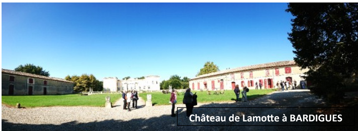
Château de Lamotte à BARDIGUES

En 2020 et 2021, nos visites ont connu un ralentissement certain, du fait des circonstances sanitaires. Nous avons repris, le 9 octobre dernier, chez nos voisins du Tarn et Garonne, avec les visites du château de Lamotte-Bardigues, de l'église baroque de Lachapelle et du très beau village d'Auvillar.