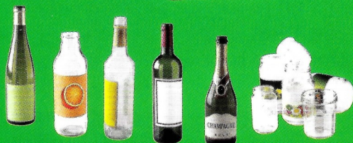
Bouteilles, pots, bocaux et flacons