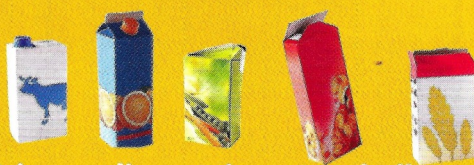
Briques alimentaires et emballages en carton

JE DÉPOSE DANS LA BORNE « Emballages en verre à recycler »