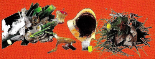
Déchets de cuisine et de jardin