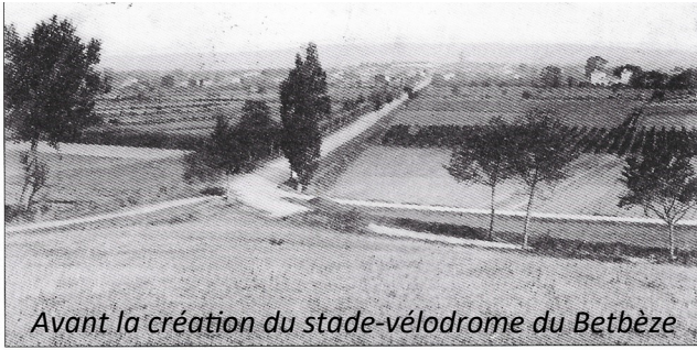
Avant la création du stade-vélodrome du Betbèze

Inauguré le 20 août 1922, le vélodrome du Betbèze n'était alors qu'une piste de terre battue entourant un terrain de rugby.