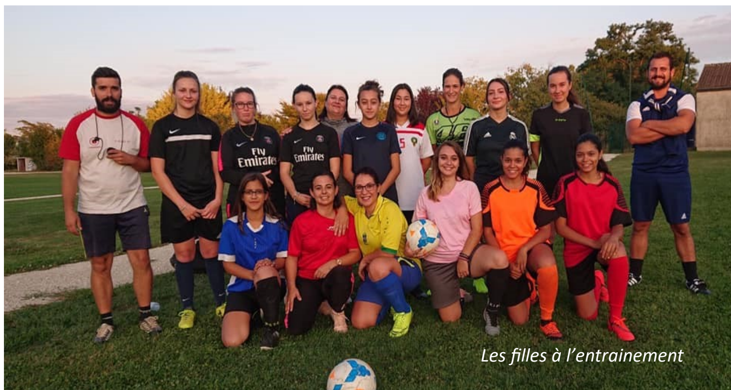
Les filles à l'entraînement