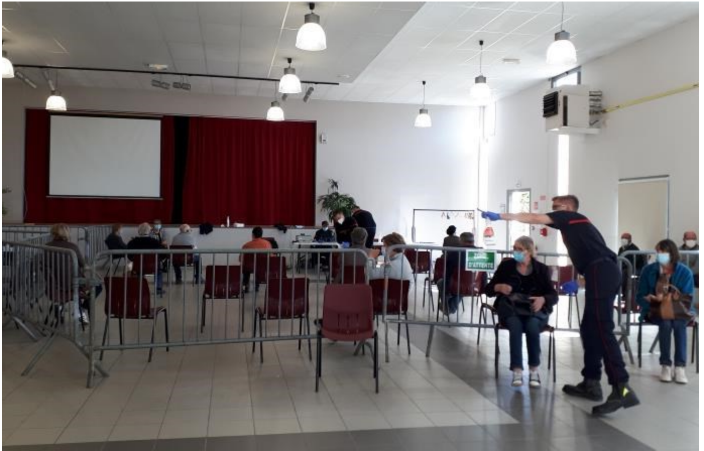
Salle d'attente d'un côté des barrières, salle de repos de l'autre.