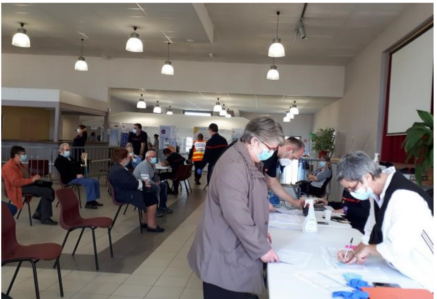
Et pour finir, rendez-vous est pris pour la seconde injection.