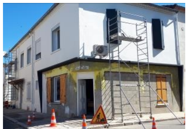
Premières façades en cours de rénovation avec le soutien de l' « opération façades ».

«... le maintien en bon état des façades concourt à l'amélioration du cadre de vie et permet de valoriser le patrimoine, non seulement au niveau de la plus-value susceptible d'être faite, mais surtout en protégeant l'intérieur du bâti des aléas climatiques notamment en empêchant la maçonnerie d'être détériorée. »