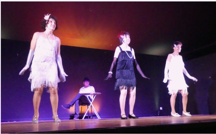
(un peu du spectacle 2025)